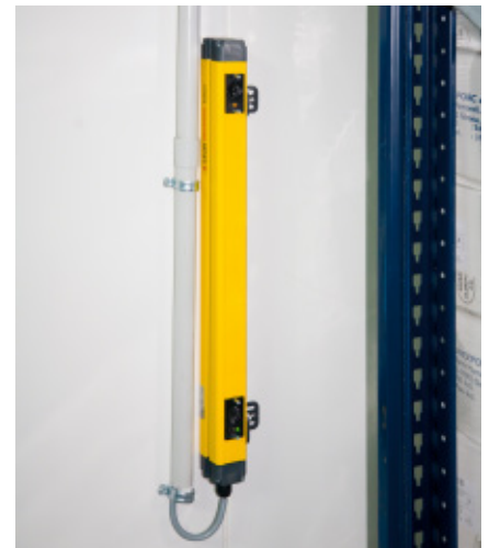
Barreira de segurança exterior

As estantes Movirack são adequadas para as câmaras de congelamento, uma vez que o consumo de energia por palete armazenado é mais baixo graças à otimização do volume da câmara